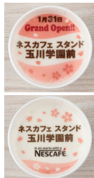
「ネスカフェ オリジナルラテアート メニュー」 （イメージ）