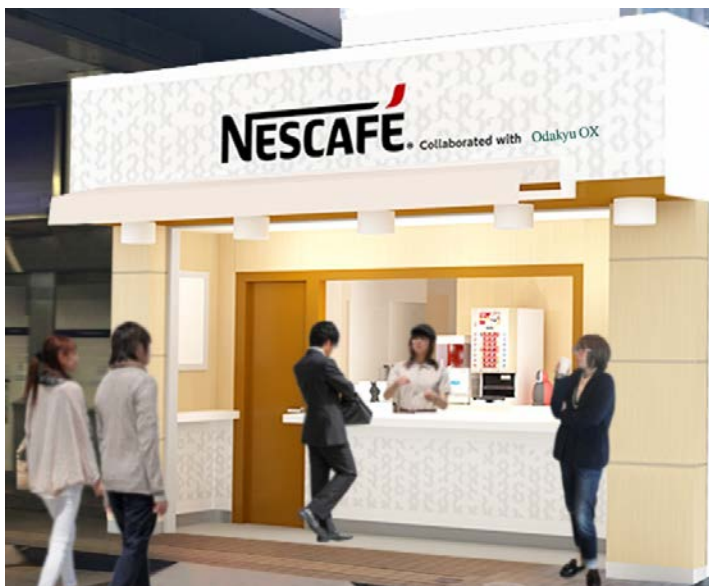
「ネスカフェ スタンド 小田急玉川学園前店」 （イメージ）