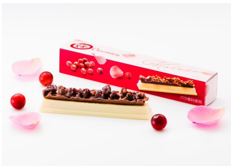
キットカット ショコラトリー モレゾン ルージュ