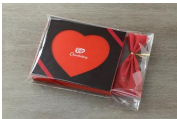
1. ギフトを受け取る