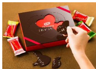
2. パズルを組み立てる