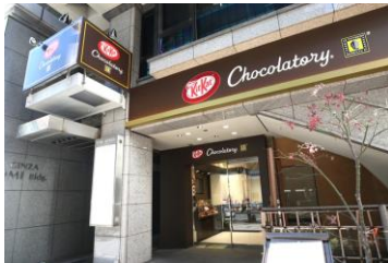
1. 銀座本店を訪れる