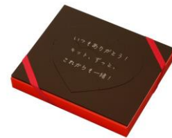
3. オリジナルメッセージを受け取る