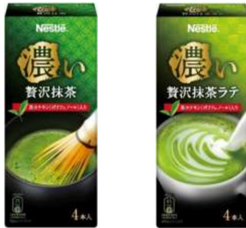
写真(左から):「ネスレ 濃い贅沢抹茶 4本入り」「ネスレ 濃い贅沢抹茶ラテ 4本入り」