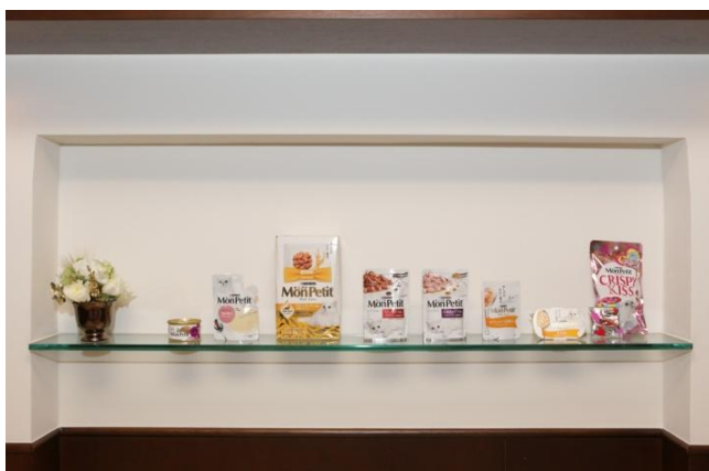
【モンプチ製品と本レストランで提供する料理】