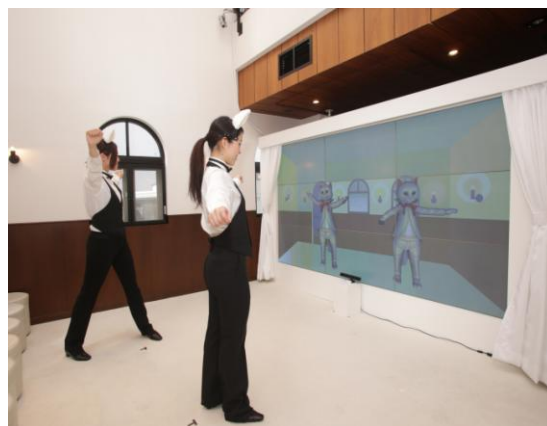
【ネコになった自分の姿が映ります。】