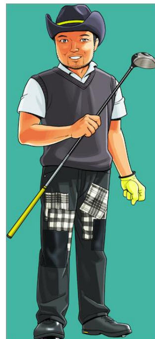
▲片山晋呉選手のオリジナルキャラクターイラスト