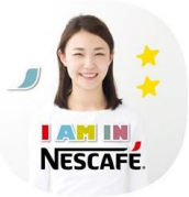
②ペッパーくんが撮影！