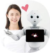
①ペッパーくんと撮影！