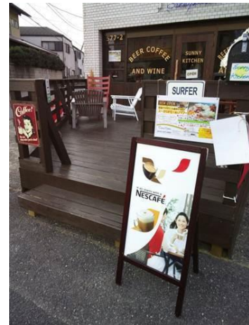
「ネスカフェ サテライト」の一例