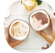
⑤つながる写真を撮る！