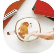
④好きな画像を選ぶ！