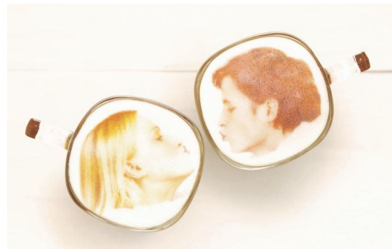
写真(左から): 「ネスカフェ フォトラテ」、 「ネスカフェ フォトラテ」を使用したラテアートのイメージ

「ネスカフェ フォトラテ」は、ラテの泡の上に画像をプリントするという新しい技術を導入し、お持ちのスマホ写真を送るだけで、カンタンにその画像をラテアートにすることを可能にした、画期的なマシンです。