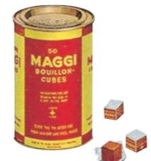
1960年当時のMAGGIブイヨン 1960's MAGGI Bouillon