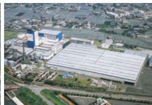
島田工場 SHIMADA FACTORY