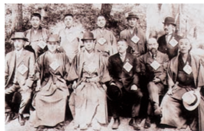
大正初期の「ネスレ特約店会」 Nestlé's trade customers (early 1910's)