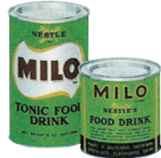
1960年当時のMILO 1960's MILO