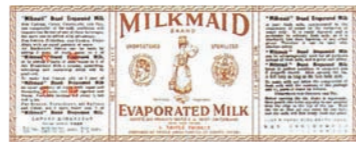
1950年当時の ミルクメイド無糖煉乳のラベル 1950's MILKMAID Evaporated Milk packaging