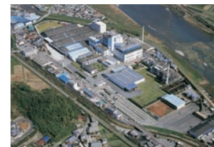
姫路工場 HIMEJI FACTORY

霞ヶ浦工場 〒300-0622 茨城県稲敷市神宮寺字迎山1751 TEL.029-894-2865 FAX.029-894-2985