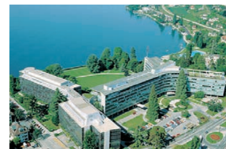
ネスレグループ本部(スイス・ヴェヴェー) Nestlé Headquarters (Vevey, Switzerland)