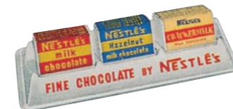
1961年輸入のネスレチョコレート Imported Nestlé Chocolate (1961)