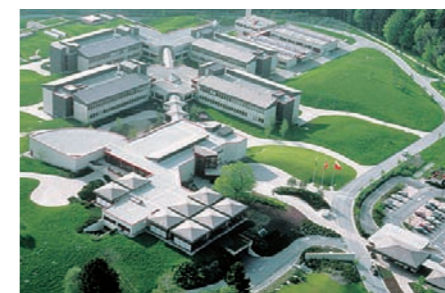
ネスレリサーチセンター(スイス・ローザンヌ近郊) Nestlé Research Centre (near Lausanne, Switzerland)