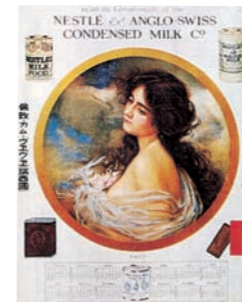
1922年のネスレ・アングロ・スイス 煉乳会社のカレンダー Nestlé and Anglo-Swiss Condensed Milk Company's calendar (1922)