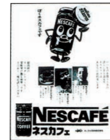
1961年のNESCAFÉの新聞広告 First NESCAFÉ newspaper advertisement in Japan (1961)