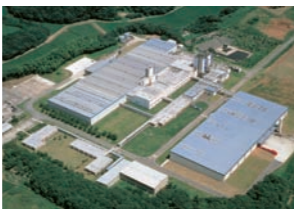
霞ヶ浦工場 KASUMIGAURA FACTORY

〔全3工場〕 ・食品安全マネジメントシステムISO22000認証取得済み ・環境マネジメントシステムISO14001認証取得済み ・労働安全衛生マネジメントシステムOHSAS18001認証取得済み